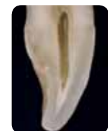
Prof. Marleen Peumans (Belgium)

A hagyományos színrendszerek különböző színárnyalatokra épülnek, amik A, B, C és D néven ismertek. Ugyanakkor tudjuk, hogy a zománcnak és a dentinnek más a karakterisztikája , és mindkettő hozzájárul a fog végső színének érzékeléséhez. Azáltal, ha elszakadunk a hagyományos monokromatikus színektől, és az enamel és a dentin karakterisztikájának reprodukálására fókuszálunk , mindössze két egyszerű réteggel juthatunk egy sokkal természetesebb eredményhez.